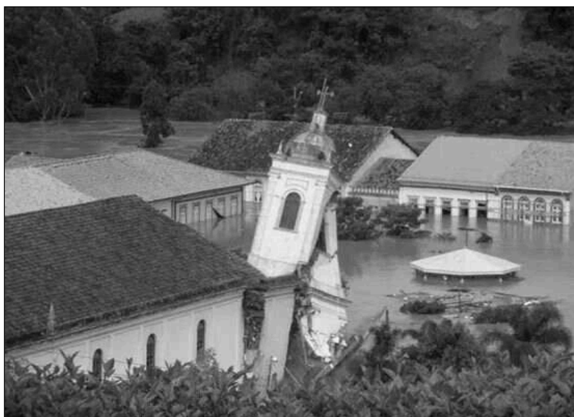
Imagem 1. Torre da Igreja Matriz no momento da queda - foto de 2 de janeiro de 2010

A imagem 1 revela o impacto das águas do rio Paratinga sobre construções do século XIX feitas de taipa de pilão (terra socada). No caso da Matriz, a presença de algumas paredes de alvenaria tornou o prédio ainda mais vulnerável, pois o peso da construção sólida exerceu ainda mais pressão sobre a base de taipa encharcada e transformada em lama.